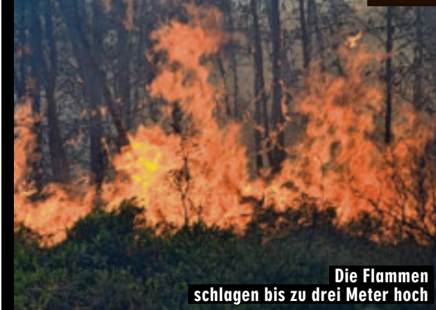
Die Flammen schlagen bis zu drei Meter hoch

Torgelow – Anhaltende Trockenheit und kräftige Winde führten am Samstag gleich zu zwei Waldbränden in Vorpommern. Bei Torgelow loderten 2000 Quadratmeter Unterholz mit bis zu drei Meter hohen Flammen. Schaden: 3000 Euro. In Meiersberg bei Ueckermünde fackelten fast zeitgleich zwei Hektar Kiefernwald ab. Schaden hier: 20 000 Euro. Feuer-Ursachen: vermutlich fahrlässige Brandstiftung.